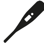
Koorts vanaf 38 graden